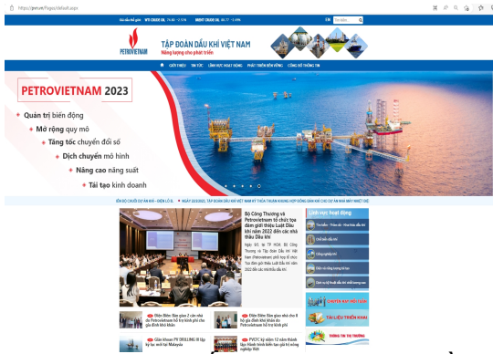
Webiste chính thống của Tập đoàn Dầu khí Việt Nam sử dụng tên miền quốc gia “.vn” (pvn.vn)